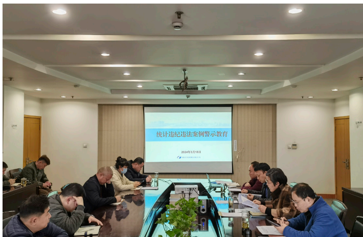
2024年3月 鼓楼区统计局召开统计违纪违法案例警示教育会