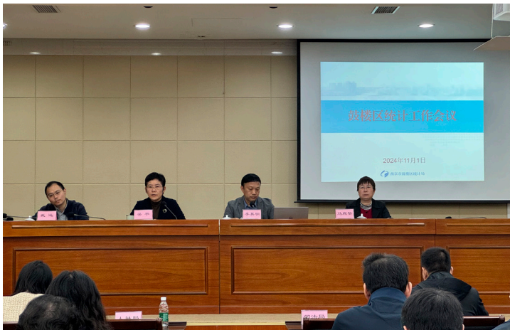
2024年11月 鼓楼区统计局召开全区统计工作会议学习贯彻新修改《统计法》