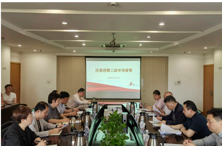
2024年5月 鼓楼区委巡察二组在区统计局开展专项督察