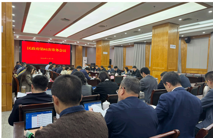
2024年11月 鼓楼区政府常务会学习新修改《统计法》