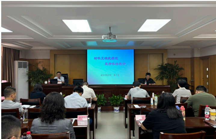
2024年9月 鼓楼区邀请南京市统计局二级巡视员陈千茂在党校开展新修改《统计法》学习教育