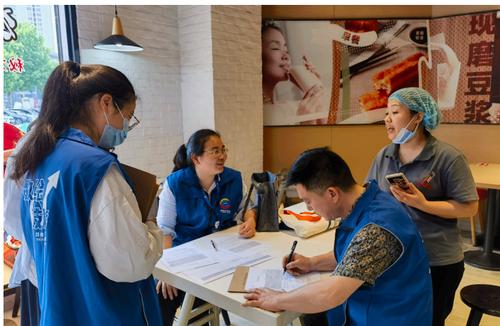
2024年5月 鼓楼区经普办于西城岚湾开展“五经普” 实地核查工作