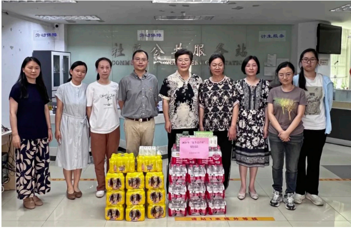
2024年8月 鼓楼区统计局走进五塘村社区和白云社区送温暖