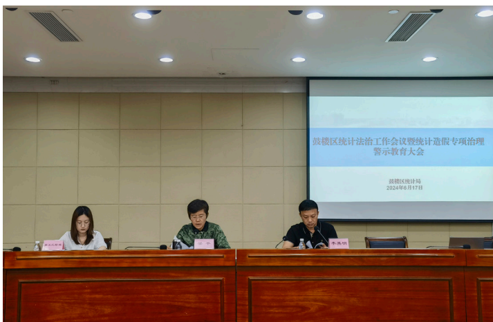
2024年6月 鼓楼区统计局召开全区统计法治工作会议暨统计造假专项治理警示教育大会