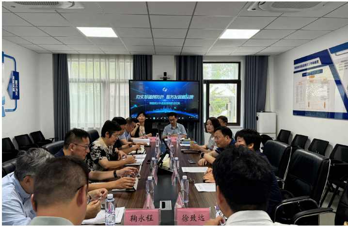
2024年7月 鼓楼区统计局赴江宁区进行统计基层基础学习交流