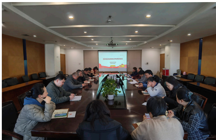
2024年1月 鼓楼区统计局召开组织生活会及民主党员评议会