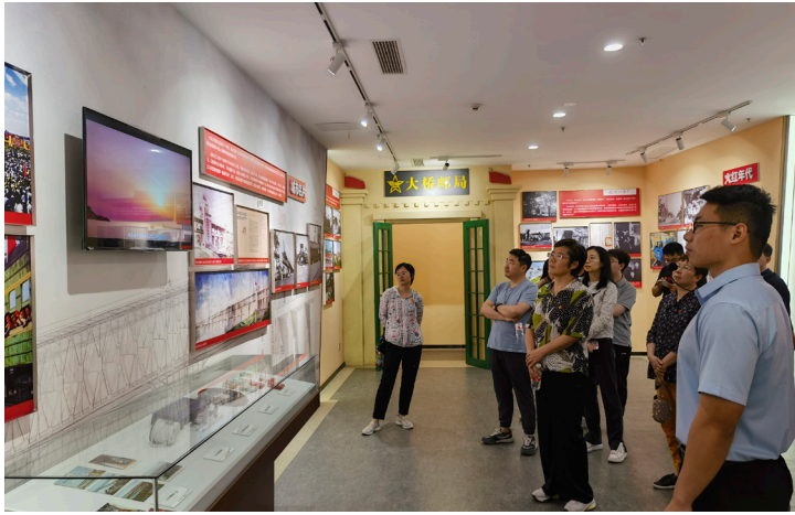
2024年6月 鼓楼区统计局组织参观红色档案馆