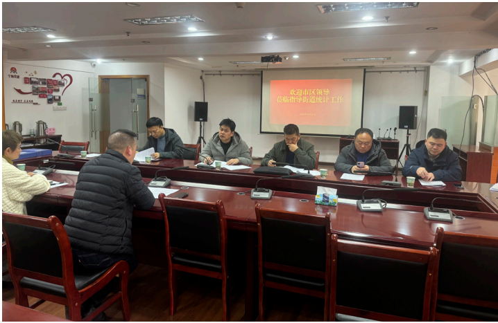
2024年2月 南京市统计局赴鼓楼区宁海路街道开展统计基层基础检查工作